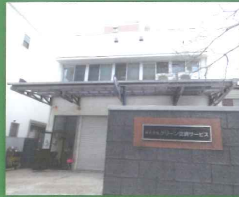
空調設備のスペシャリストとして40年以上

オフィスビル、ホテル、ショッピング・エンタメ施設などの大型空調設備の保守点検・工事を通じて、利用者様にクリーンで安全な空気を届け続けて約半世紀。空調のメンテナンスを通して私たちの生活を守っています。