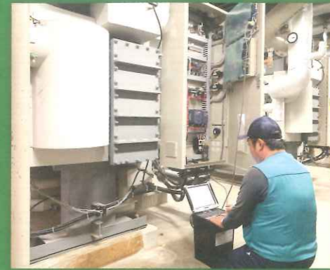
高い専門ノウハウと実績を持つ職人企業です